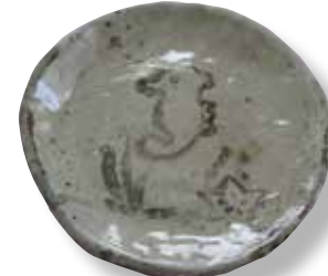
個性あふれる作品の完成！