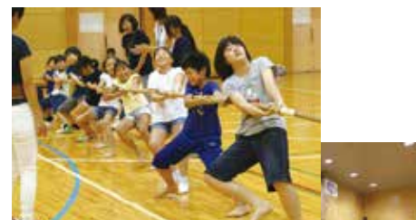
綱引き&ドッジボール それぞれ子供の部、大人の部に分かれ、どちらも一生懸命戦いました