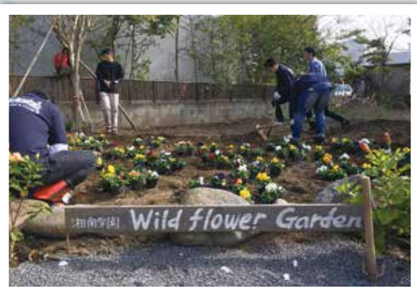
同日活動! Wild Flower Garden