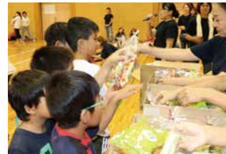
参加賞に子ども達も大喜び！