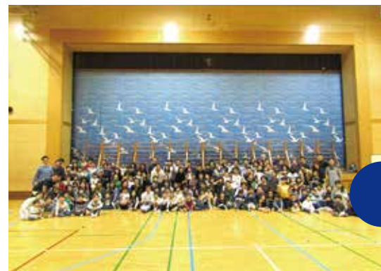
15:30 終了 充実の1日、皆様、お疲れ様でした