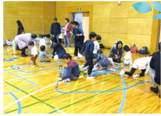
うわー!長い、どこまでも!