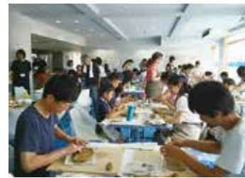
大勢の方にご参加いただきました