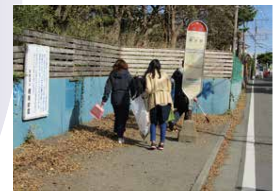
10:00 ~ 地域清掃 (45分間)