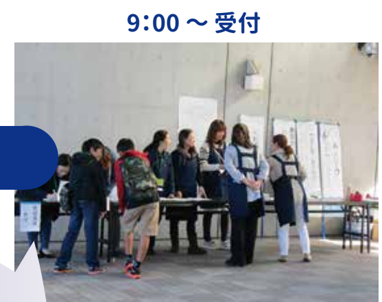
9:00 ~ 受付