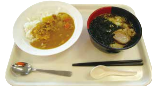
カレーライスも、中華そばも美味しかった