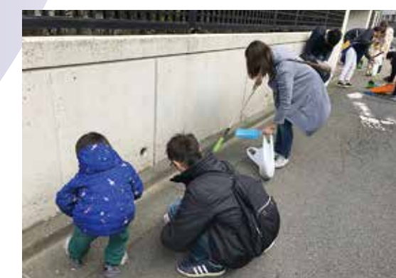
学園周辺キレイさっぱり、掃除って気持ち良いな!