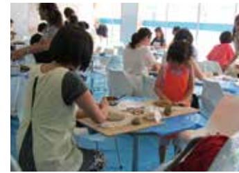
粘土を練って、弁柄顔料で絵付け