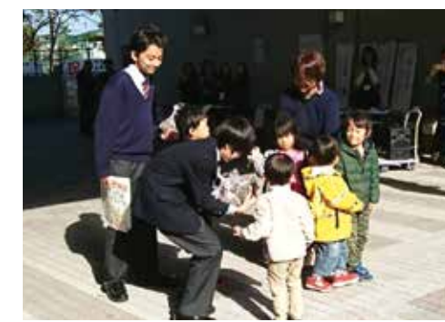
園児から中高生徒会へヒマワリの種を贈呈