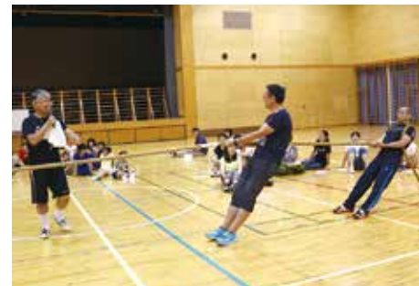
横浜市綱引き連盟 副理事長によるレクチャー