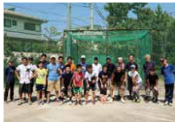
ソフトボールは、アリーナ側とバックグラウンド側の 2 箇所で開催