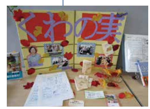
くわの実、読書の秋