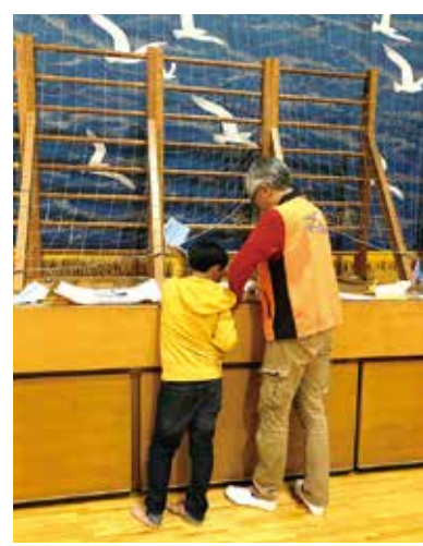
遠くまで飛ばしてみよう!