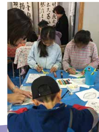
オリジナルしおりを作成中!