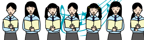
湘南学園創立80周年記念事業実行委員会