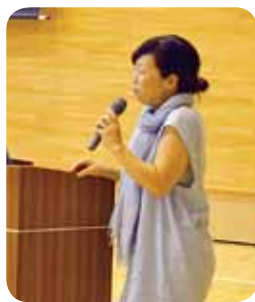
有蘭先生の「問題提起」

聞き取り調査したことや中高の総合の取組みを、パワーポイントを使って楽しく紹介、それぞれのパートの豊かな実践は、ESDという視点で見るとつながっているのではないかと問題提起しました。