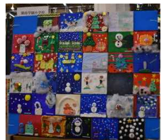
2月12日(火)～17日(日)に、神奈川県民ホールギャラリーで開催された「児童造形展」での湘南学園小学校児童の展示です。