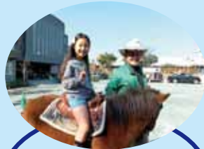
クローバー牧場からお馬さんも来ました！